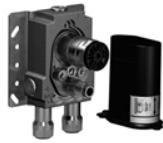
35 021 970 90 UP-Einhandbatterie mit Sicherungseinrichtung -