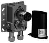
35 020 970 90 UP-Einhandbatterie -