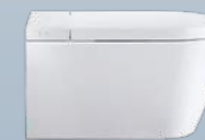
SensoWash® Starck f

Naturalmente limpio y fresco. No hay una limpieza más a fondo, más higiénica, más natural y más refrescante que la realizada con agua. Incluso después de ir al baño. Por eso, el asiento de lavado, la síntesis de inodoro y bidé, resulta cada vez más popular. El agua brinda una placentera sensación de frescura y es más suave y más agradable que el papel higiénico. Así, tras usar el asiento de lavado, permanece en el usuario una sensación de limpieza y agradable vitalidad. Con SensoWash®, Duravit aporta un programa innovador y sofisticado de asientos de lavado que satisfacen las necesidades modernas de limpieza higiénica y elevado confort de manejo.